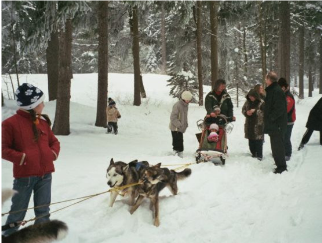
Beslankinder mit Hundeteam2

Aufmerksam beobachteten alle, wie die Hunde eingespannt werden, dass dabei jeder der Hunde seinen Platz genau kennt und dass die Freude groß ist, endlich arbeiten zu dürfen. Schließlich wurden die beiden ersten Kids in den Schlitten gesetzt und dann ging es ab mitten hinein in den unberührten Tiefschnee.