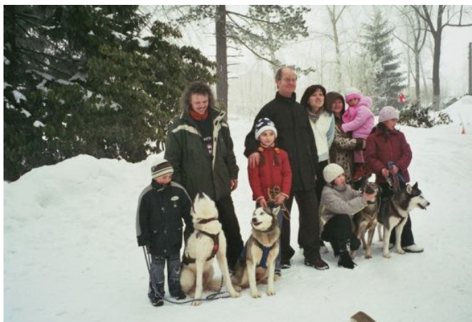
ein Teil der Familien aus Beslan beim Gruppenbild

Arbeit mit Schlittenhunden bedeutet für mich nicht nur Training, Touren und Rennen. Seit über einem Jahr setze ich meine Hunde regelmäßig zur Therapie in einer Mutter-Kind-Klinik in der Nähe meines Heimatortes ein. Dabei ist das Ziel, den Kindern einen ungezwungenen Umgang mit Tieren zu vermitteln, Ängste abzubauen (das gilt in den meisten Fällen jedoch eher für die Mütter) und durch die Interaktion Mensch-Tier psychische Spannungen zu lösen. Nach anfänglicher Skepsis seitens der Klinikleitung und ein paar „Probetreffen“ zeigte sich, dass die Begegnungen mit den umgänglichen Vierbeinern sehr gut ankommen und bleibende Eindrücke bei Groß und Klein hinterlassen. Mittlerweile sind die Begegnungstunden zwischen Mensch und Husky fester Bestandteil des Programms der Mutter-Kind-Klinik und werden sogar in die Öffentlichkeitsarbeit der Klinik einbezogen und entsprechend beworben. Im März dieses Jahres wurde eine besondere Anfrage an mich gestellt. Für drei Wochen sollten Mütter und Kinder aus Beslan zu einem Erholungs- und Therapieaufenthalt in der Klinik weilen.