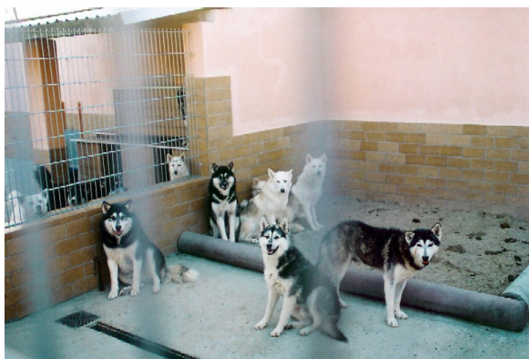
Die Auffangstation und die Hundepension platzten in diesen vier Wochen aus allen Nähten.

Anlage für Anlage räumten wir und setzten die Hunde in die Hundeanhänger. Nach nur einer Stunde hatten wir bereits 48 Hunde, die in unsere Station sollten. Überwiegend fanden wir Schäferhunde, Huskys, weiße kanadische Schäferhunde und Mischungen aus allem. Einzigste Ausnahme bildeten zwei Dackel, die ich ganz zum Schluss in dem Wohnwagen mit den 30 großen Hunden gefunden hatte. Fast alle Hunde begegneten uns zunächst freundlich, wurden jedoch panisch und bissen wild um sich, als wir ihnen Leinen um den Hals legen wollten. Kein Hund hatte je eine Leine oder ein Halsband um, sie kannten das nicht und reagierten deshalb sehr ängstlich. Hatten wir sie mit der Leine oder Fangschlinge gefangen versuchten wir sie trotz Beißattacken sofort auf den Arm zu nehmen und zu tragen. Nur so konnten wir ihnen die Angst nehmen und nur so wurden sie auch wieder friedlich. Stunde um Stunde leerten wir die Anlagen, fuhren nach Hohenbruch, um die Tiere in die Anlage zu bringen und zurück zum Einsatzort. An Frühstück war um 4 00 Uhr früh noch nicht zu denken und als die Aktion gegen 15 00 Uhr beendet war, hatten wir immer noch nichts gegessen.