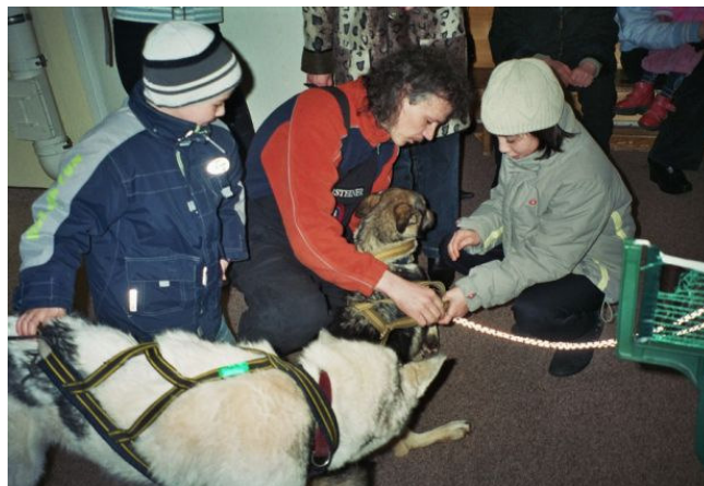
Beslankinder beim Hundeanziehen

Das ganze immer wieder mit kurzen Pausen, um der Dolmetscherin die Möglichkeit zu geben, das Erzählte weiterzugeben. Längst lagen die Kids kreuz und quer mit unseren Vierbeinern am Boden. Die Frauen erkundigten sich interessiert, wie wir leben, wie wir den beruflichen Alltag und die Arbeit mit den Hunden bewältigen und wie unsere eigenen Kinder mit den Hunden klarkommen. Anschließend übten wir mit den Kids, wie den Hunden Geschirre und Booties angezogen werden.