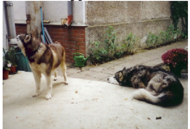
Nala und Zeus