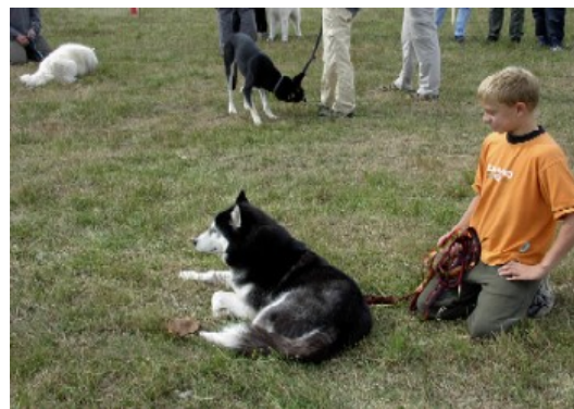
sowie Appetit waren unter anderem bei den Aktivitäten gefragt