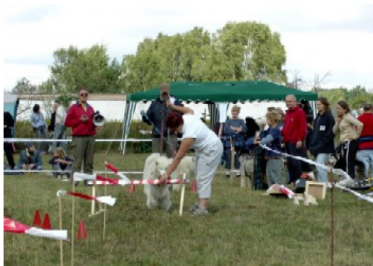
Geschicklichkeit bei Hund....