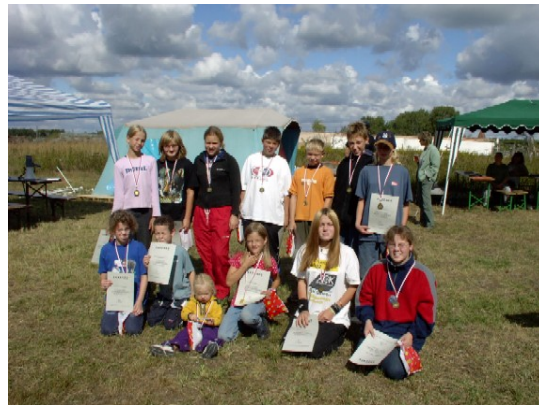
und auch die Kinder waren stolz auf ihre Erfolge beim Junior-Handling....