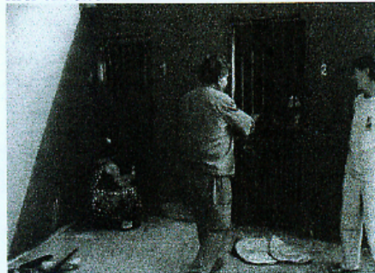
Tötungsstation Sant Bartolome