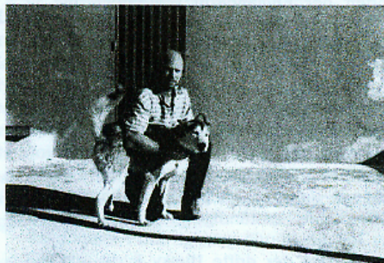
Ralf und Tao

sieben Jahre alte Malamute Hündin sollen wir Euro 55,00 bezahlen. Eigentlich kann es sich unser Verein nicht leisten Hunde finanziell auszulösen. Nachdem ich mir jedoch die Zustimmung vom restlichen Vorstand geholt habe und die Tatsache, dass diese Hündin hier seit einem Jahr in sehr beengten Verhältnissen lebt, hat uns den Entschluss fassen lassen für diese Hündin den Preis zu bezahlen. Wir werden jedoch versuchen, für die Zukunft eine andere Lösung zu finden. Durch eine engere Zusammenarbeit mit dem ETN (Europäischer Tier- und Naturschutz e.V.) hoffe ich auf Besserung der Zusammenarbeit mit den Institutionen vor Ort im Sinne der auf Lanzarote oder auch anderswo untergebrachten Hunde. Innerhalb Deutschlands Tierschutzvereinen kenne ich es auch nicht gegenseitig Schutzgebühren oder Unkosten zu bezahlen.