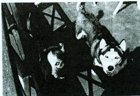
Hunde der Engländerin

Wir erhalten ihre Telefonnummer und schon zehn Minuten später sitzen wir in ihrem Apartment und die zwei neun- und sechsjährigen Siberian Huskys liegen schwer hechelnd vor unseren Füßen. Draußen sind es 33°C hier drinnen nur wenig kälter. Das ist wirklich keine Umgebung für Nordische. Wir wollen auch hier helfen und trotz des Alters und einer Epilepsie Erkrankung der Hündin beide nach Deutschland holen.