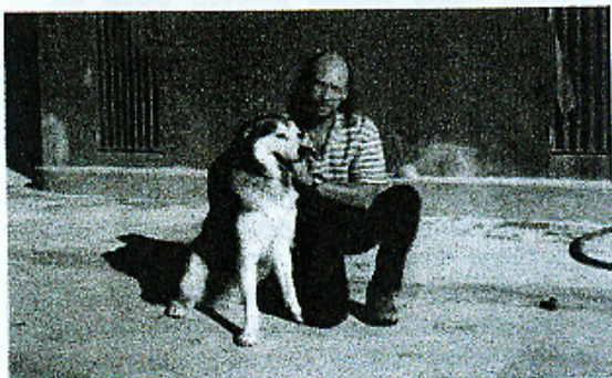
Ralf und Macho

"Schlampe" auch noch häufig war, beschlossen wir sie bei uns im Haus zu lassen.